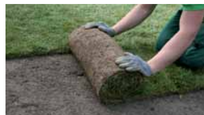
Einfaches und schnelles Verlegen

Als farbige Alternative bietet sich der Blumenrasen an, welcher sich für Parkanlagen, Kreisel, Gewerbebauten oder Einfamilien-