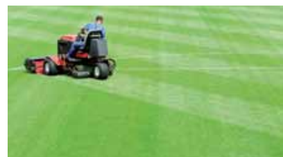
Schon nach kurzer Zeit belastbar

Sie profitieren von bester Qualität und kurzen Lieferzeiten.