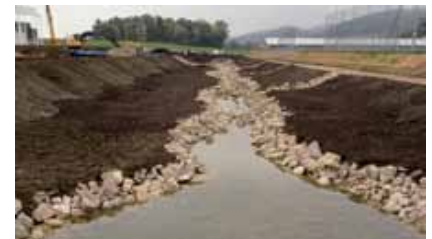
Vor der Begrünung