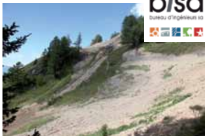
Nicht nur für die Skifahrer eine Herausforderung