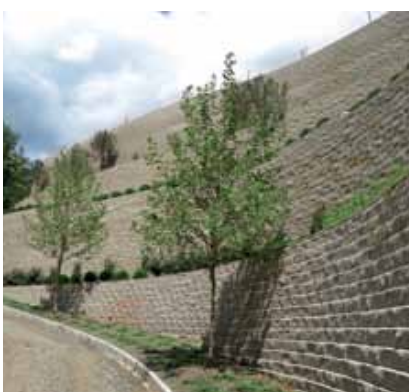
Terrassenförmige Stützmauer 15 m hoch