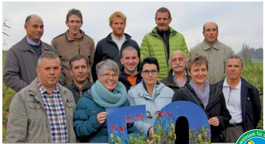
Das aktuelle Team

Kaum eine Begrünung ist zu spektakulär für das Team der Hydrosaat AG . Begrünt wird fast überall dort, wo Grün erwünscht wird. Auch nach 50 Jahren strebt die Hydrosaat AG ein partnerschaftliches Verhältnis mit den Kunden