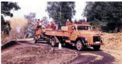
Ansaat anno 1969

Das Arbeitsgebiet der Mitarbeiter umfasst alle französischen Kantone sowie die Kantone Bern, Solothurn und Wallis. Die Hydrosaat AG verkauft auch natürliche Erosionsschutzprodukte von bester Qualität und vertreibt ihren Fertig- und Blumenrasen aus Schweizer Produktion. Die Kunden werden professionell beim