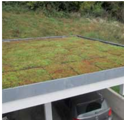
Carport in Corsier-sur-Vevey

Begrünte Dächer bringen die Natur in die Siedlungen zurück. Ein grosser Befürworter von Gründächern war der Künstler Friedensreich Hundertwasser, der diese als wichtigen Teil der von ihm angestrebten Versöhnung von Mensch und Natur sah. Dazu finden Sie unter www.blumau.com (Architektur) ein Musterbeispiel einer Dachbegrünung. Die Hydrosaat AG durfte die Dächer von sieben Einfamilienhäusern in La Tour-de-Peilz und zwölf Carports in Corsier-sur-Vevey fachgerecht begrünen. Weitere spannende Info's unter www.xeroflor.ch