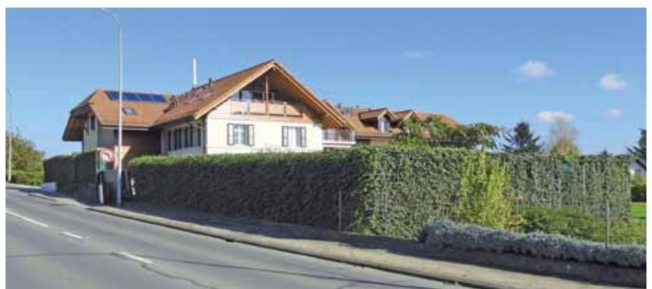
Die begrünte Lärmschutzwand Silencia dient auch als ästhetischer Sichtschutz

In Prangins erstellte die Hydrosaat AG eine 40 Meter lange Lärmschutzwand Silencia in Holzstruktur. Mit ihren drei Metern Höhe bietet sie auch einen idealen Sichtschutz zu den Wohneinheiten vis-à-vis. Diverse Efeusorten hüllen sie in ein grünes Kleid. Im selben Ort wurde eine weitere grosszügige Schutzwand gegen den Strassenlärm gebaut. Die Unterkonstruktion wird durch die beidseitige Begrünung perfekt überdeckt. Begrünte Lärmschutzwände integrieren sich in die Umgebung und strahlen eine natürlich Atmosphäre aus.