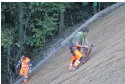
Das Kokosgewebe wird am Steilhang verlegt

Die Böschung zwischen Strasse und Gebäude, mit Wandkies erstellt, ist sehr steil. Zuerst wurde auf die Oberfläche ein Ecotex-Kokosgewebe als Erosionsschutz verlegt. Die Mitarbeiter der Hydrosaat AG mussten diese Arbeit am Seil gesichert ausführen. Danach erfolgte die Begrünung durch Nasssaat mit einer extensiven Blumenwiese-Mischung.