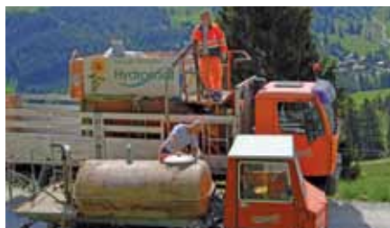
Die Begrünungsmischung wird vorbereitet

Die Wegböschungen der Alpstrasse wurden durch die Hydrosaat AG neu begrünt. Die Nasssaat mit standortgerechter Samenmischung und doppelter Strohmulchabdeckung erfolgte in zwei Arbeitsgängen mittels eines Spezialfahrzeuges.