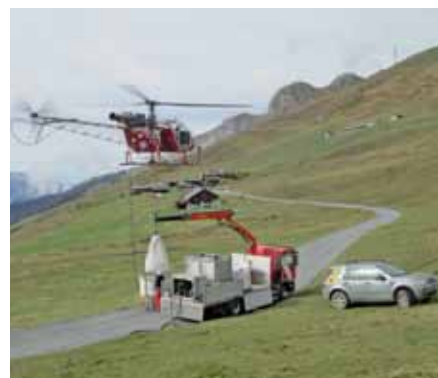
Per Kran wird das Streugerät beladen

Auf 1700 m.ü.M. wurde per Helikopter eine Fläche von 12'000 m 2 mit 1'800 kg Samenmischung „Hochlage“ trocken angesät. Diese sogenannte Schlafsaat beginnt erst im Frühling 2015 zu keimen.