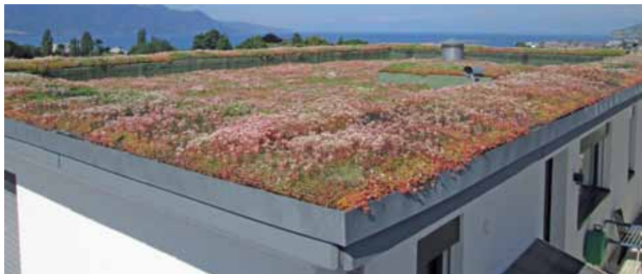
Xeroflor-Dach in La Tour-de-Peilz