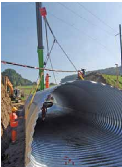
Einbau eines Wellstahldurchlasses in Belfaux

Die Freiburgischen Verkehrsbetriebe TPF haben nicht geschützte Bahnübergänge aufgehoben. Die Hydrosaat AG durfte dazu vier Wellstahldurchgänge liefern.