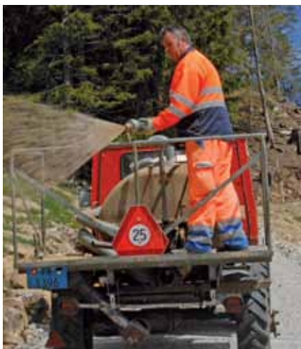
Begrünung per Allradfahrzeug