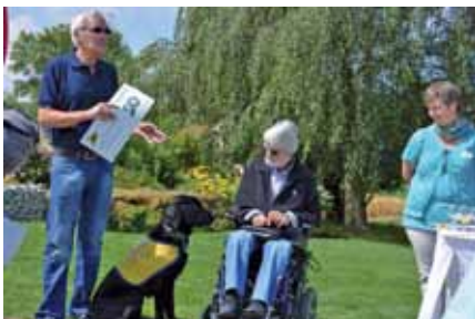
Die Checks werden dankbar angenommen

mit den Behinderten vor, und da fiel vor allem auf, wie viel Herzblut in ihrer täglichen Arbeit steckt. Der Dank ob dem unerwarteten Geschenk war gross und berührend. Am Schluss musste noch die einte oder andere Träne getrocknet wer-