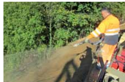
Begrünung durch Nasssaat