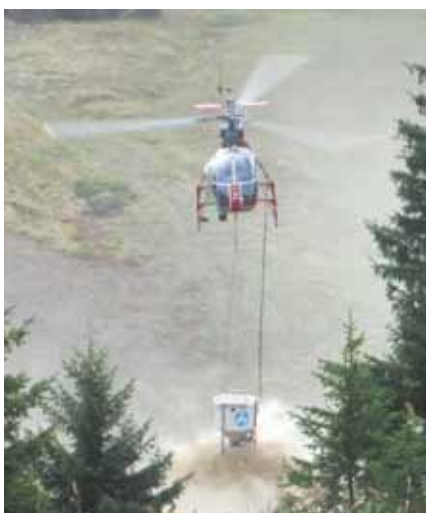
Ausbringen der Mischung

Für die Begrünung der Skipiste wurden vier Überflüge benötigt.