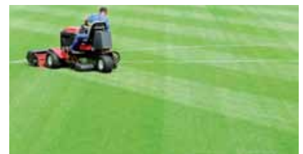
Praticable après peu de temps

ments artisanaux ou d'habitations individuelles. Nos clients bénéficient d'un gazon ou d'une prairie fleurie de qualité et de courts délais de livraison. Profitez d'un tapis végétal vivant!