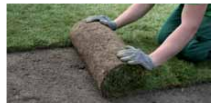
Pose simple et rapide

Le gazon pré-cultivé est posé en quelques heures et peut être foulé le lendemain déjà. Une solution de remplacement originale consiste à dérouler un gazon ou une prairie fleurie, qui convient idéalement à l'aménagement de parcs, giratoires, bâti-