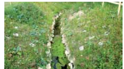
Après 3 mois, la végétation se densifie