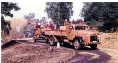
Technique d'ensemencement en 1969

professionnels de la protection contre l'érosion et du génie biologique. En 1998, Hydrosaat SA est la première entreprise spécialisée dans le reverdissement à obtenir le certificat ISO 9002. Il n'est guère de projet de reverdissement