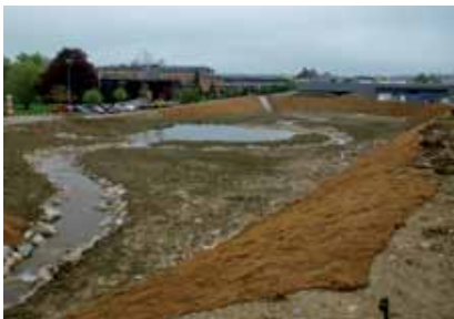
Les filets en fibres de coco préviennent l'érosion

Ecotex® KG400 sur une surface en pente de 6000 m 2 .