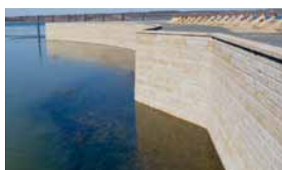
L'esthétique pour la stabilisation de rives