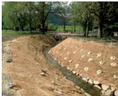
Les disques en feutre facilitent l'entretien