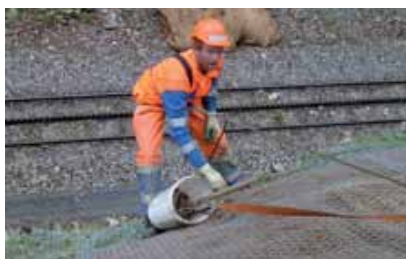
Travaux spectaculaires de stabilisation de pente

50 ans après sa création, Hydrosaat SA aspire toujours à un rapport partenarial avec ses clients. Notre philosophie reste elle aussi la même: demeurer, innover, fournir des services et des produits de qualité tout en respectant l'environnement. D'une manière générale, notre objectif est de proposer des solutions écologiquement durables en matière de reverdissement et de protection contre l'érosion.