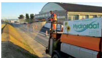
Ensemencement réalisé en 2013

professionnels de la protection contre l'érosion et du génie biologique. En 1998, Hydrosaat SA est la première entreprise spécialisée dans le reverdissement à obtenir le certificat ISO 9002. Il n'est guère de projet de reverdissement