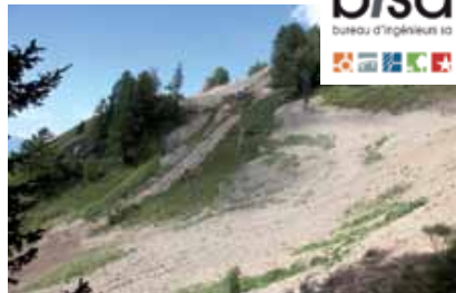
... est un défi pour les skieurs