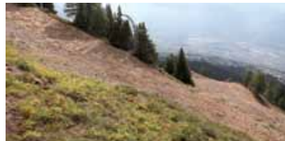
... déjà très difficile à maîtriser à pied ...

couche de couverture anti-érosion constituée de paille courte. Longue de 2471 mètres, la piste de Coupe du Monde représente une surface totale de 45'000 m 2 .