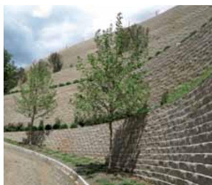
Mur de soutènement en terrasse d'une hauteur de 15 m