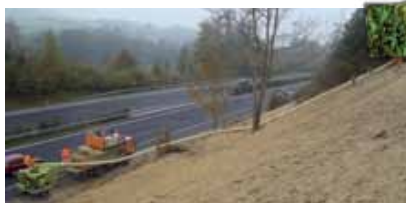
Semis en bordure de l'autoroute A1

50 ans après sa création, Hydrosaat SA aspire toujours à un rapport partenarial avec ses clients. Notre philosophie reste elle aussi la même: demeurer, innover, fournir des services et des produits de qualité tout en respectant l'environnement. D'une manière générale, notre objectif est de proposer des solutions écologiquement durables en matière de reverdissement et de protection contre l'érosion.