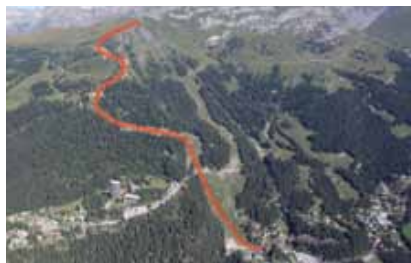
La piste ...

Conseiller technique Hydrosaat SA, secteur Valais